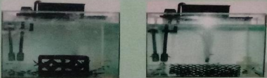
Gambar akuarium tempat pemeliharaan benih

Pembesaran Black Ghost biasanya dilakukan dalam akuarium dimana ukuran antara 3 – 4 inci. Ukuran akuarium disesuaikan dengan jumlah dan ukuran anak black ghost yang akan dibesarkan. Sebagai contoh akuarium berukuran 100 x 35 x 50 cm dapat diisi anak black ghost yang baru menetas 3-4 hari sebanyak 200 – 250 ekor. Kualitas air yang cocok bagi kehidupan black ghost adalah : suhu 26 – 27°C ; pH 6 – 7 dan kekerasan 6 – 10° dH. Untuk mengetahui kesiapan air yang akan digunakan untuk pembesaran black ghost maka dapat diuji dengan melihat reaksi ikan. Caranya, masukkan 1-3 ekor black ghost ke dalam akuarium yang telah diisi air. Apabila black ghost langsung bersembunyi berarti air tersebut telah dapat digunakan. Namun bila black ghost naik ke permukaan dan terlihat lemas berarti air tersebut belum siap digunakan. Perlengkapan utama yang harus ada dalam akuarium pembesaran adalah aerator dan tempat persembunyian. Untuk tempat persembunyian dapat digunakan akar bakau, pralon, roster bata, plastik gelombang dan daun bacang atau daun ketapang kering.