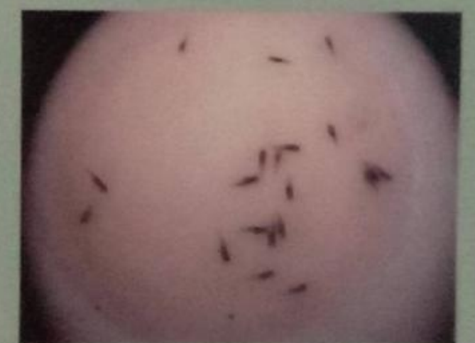
Gambar benih Black Ghost

Dalam waktu 3 – 4 hari telur black ghost akan menetas. Namun hanya telur fertile saja yang akan menetas. Telur yang fertile ditandai dari warnanya yang kuning cerah dan diliputi lendir. Sementara telur yang steril berwarna putih susu tidak akan menetas. Dengan bertambahnya umur, anak black ghost berubah warna dari putih menjadi hitam, dan bersembunyi pada pakis bekas telur. Diberi pakan kutu air atau nauplii Artemia .