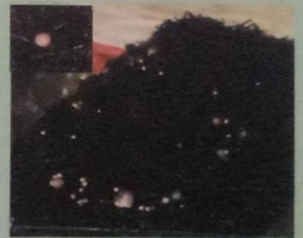
Gambar pakis untuk meletakkan telur

digunakan pakis, berkaitan dengan aktivitas black ghost pada malam hari maka peletakkan pakis sebaiknya dilakukan pada sore hari. Pakis diletakkan diantara dua keramik dan diantara pakis dan keramik diberi batu, agar telur-telur dapat masuk ke sela-sela pakis dan dapat terhindar dari mangsa induk jantan. Pengambilan sarang dan telurnya harus sepagi mungkin sebelum matahari terbit. Jumlah telur black ghost 500-1000 telur.