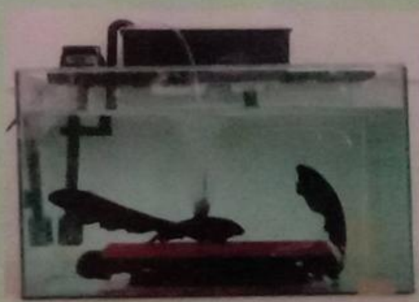
Gambar akuarium tempat pemijahan

Pakan yang diberikan adalah cacing darah ( blood worm ) dan jentik nyamuk, yang berfungsi untuk mempercepat penuaan telur. Tempat bertelur dapat